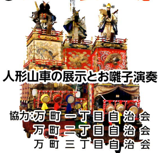
人形山車の展示とお囃子演奏