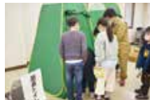
避難所用品取扱体験①