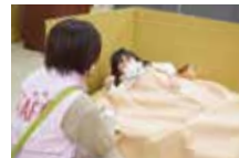
避難所用品取扱体験②