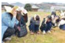
シェイクアウト訓練