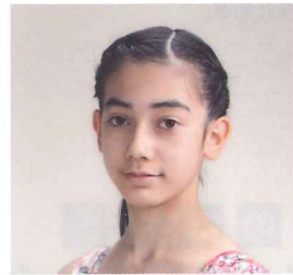
第16回栃木県ジュニアピアノコンクール 小学校5・6年生の部 最優秀賞