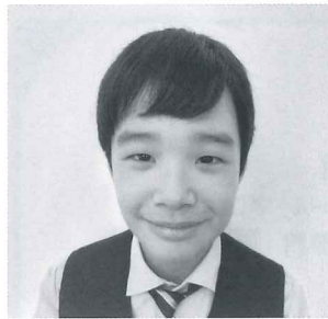
第16回栃木県ジュニアピアノコンクール 小学校3・4年生の部 最優秀賞