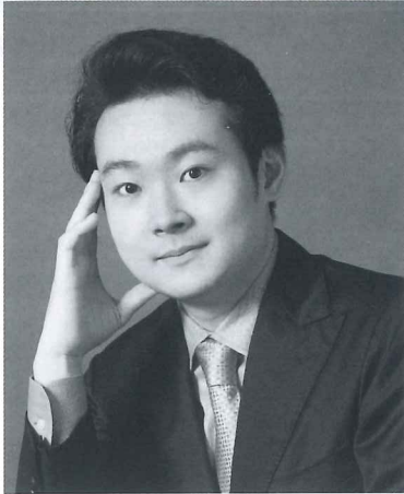
第27回コンセール・マロニエ21 ピアノ部門 第1位

◆「コンセール・マロニエ21」は、未来に飛翔する新進音楽家に発表の機会を提供し、今後の活躍を奨励する音楽コンクールです。 ◆「栃木県ジュニアピアノコンクール」は、県内でピアノを学ぶ子供たちの感性と演奏技術を育むコンクールです。