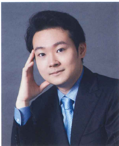
第27回 コンセール・マロニエ21 ピアノ部門 第1位