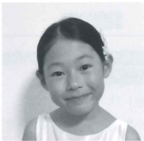
第16回栃木県ジュニアピアノコンクール 小学校1・2年生の部 最優秀賞

第27回コンセール・マロニエ21第1位。第2回藝大ピアノ・コンクール第1位受賞。第24回イル・ド・フランス国際ピアノ・コンクール《Les Sphirades》特別賞。これまでに、東京藝大フィルハーモニア管弦楽団、東京藝大ウィンドオーケストラと共演。藝大大学内において、アカンサス音楽賞、藝大クラヴィーア賞、同声会賞を受賞し、宮田亮平奨学金を授与される。東京藝大附属高校、東京藝術大学音楽学部器楽科を経て、同大学院修士課程1年在学中。これまでに、江口 玲、秦はるひ、小林 仁、海老彰子、近藤伸子、小林ゆみの各氏に師事。