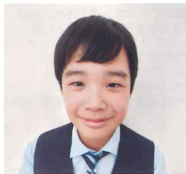
第16回栃木県ジュニアピアノコンクール 小学校3・4年生の部 最優秀賞