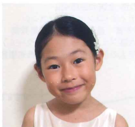
第16回栃木県ジュニアピアノコンクール 小学校1・2年生の部 最優秀賞