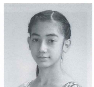
第16回栃木県ジュニアピアノコンクール 小学校5・6年生の部 最優秀賞