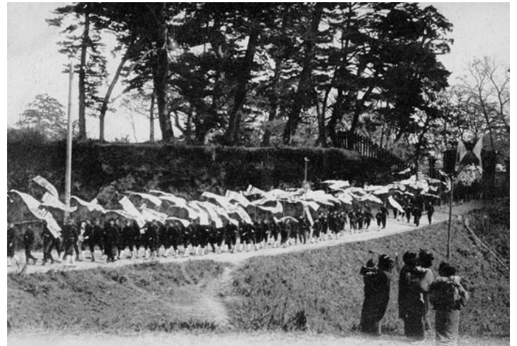
「水戸中学校門を出る偉人行列」複製ハガキ(当館蔵)