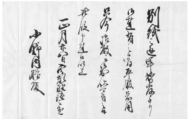
小野内膳(友五郎)海軍出仕・車務官呼出状(原史料 広島県立文書館蔵) ※写真資料での紹介となります。