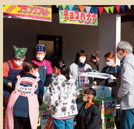
アクティブフューチャー寺尾 〈フランクフルト・チョコバナナ〉