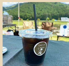
SKETCHCOFFEE&HERB 〈コーヒー・ハーブティー〉