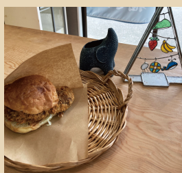
福ぞう商店 〈お惣菜〉