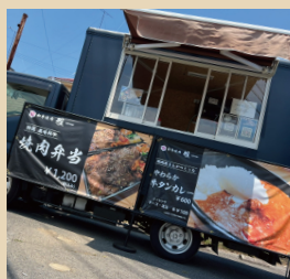
和牛焼肉 雅 〈お弁当・カレー〉