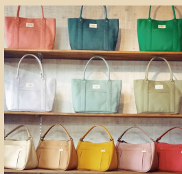
いちひこ帆布 〈バッグ〉