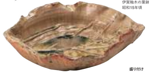
伊賀柚木の葉鉢 昭和15年頃