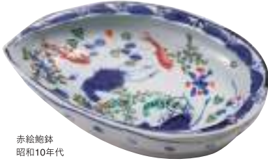
赤絵鮑鉢 昭和10年代