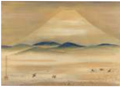
富士朝暎映嶽図 昭和15年頃 (日本画)

陶芸、書、日本画、料理など幅広い分野にわたり、独自の美意識を追求したことで著名な北大路魯山人。本展では、魯山人の美の世界を、近年再発見された茨城県内のコレクションを通して、陶磁器、漆器、日本画、篆刻、書の約70件により紹介します。