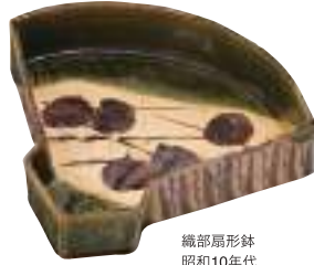
織部扇形鉢 昭和10年代