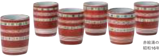
赤絵湯のみ(6客) 昭和16年頃