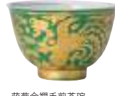
萌葱金襴手煎茶碗 (10客のうち1客) 昭和14年頃