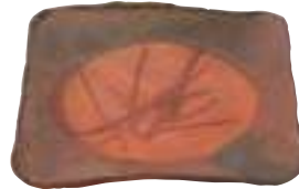
備前四方鉢 昭和30年代