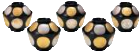
日月碗(5客) 昭和12年頃 (漆器)