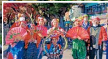
南京玉すだれ 楽しい会