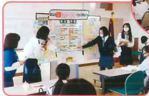
ガールスカウトの取り組み

「ジェンダー」に関する女子高生調査報告書から、第23団の中学・高校生が市の産業文化祭で来場者にアンケートへの協力をお願いし、まとめた結果を年長スカウト集会で発表をしました。ガールスカウトでは、少女たちが体験から学び、知識と技術を身につけ、さらに挑戦できるようになることを目指し、活動しています。