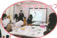
ワークショップ 5 ジェンダー平等を 実現しよう