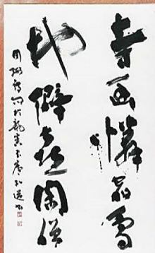
星弘道「周粥詩句」個人蔵