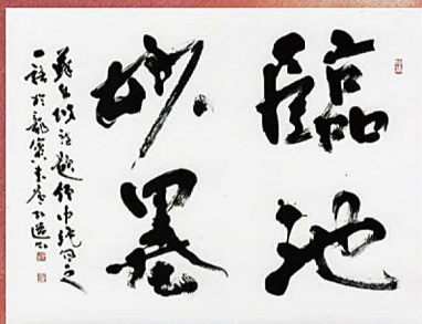
星弘道「臨池妙墨」個人蔵

1944年栃木県宇都宮市に生まれる。浅香鉄心に師事。1998年日本書作院理事長に就任。2010年第42回日展文部科学大臣賞受賞。2012年第68回日本藝術院賞受賞、日展理事就任。2022年日本藝術院会員に就任。