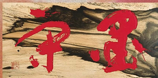
吉澤鐵之「墨守」個人蔵