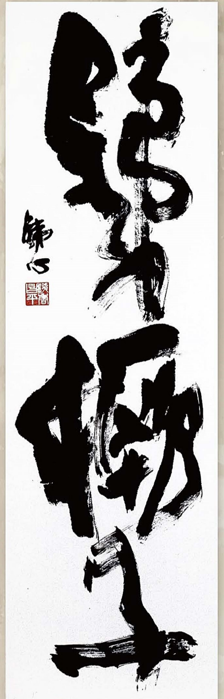
浅香鉄心「鐵樵子」しもだて美術館所蔵