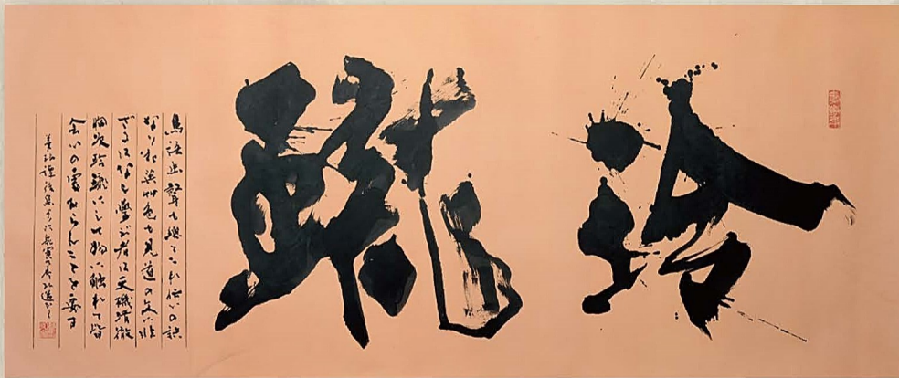
星弘道「玲瓏」個人蔵