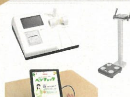
健康チェック・健康相談