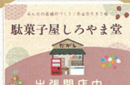
出張開店中 駄菓子販売 しろやま堂