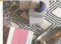
お香・お線香販売 蘭と月