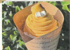
クレープ販売 banana ape