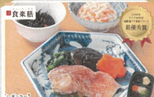
レトルト試食 訪問入浴展示