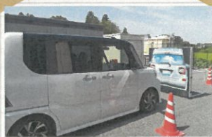
スマートアシスト搭載車 の展示・試乗体験