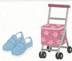
歩行器などの福祉用具 の展示・使用体験