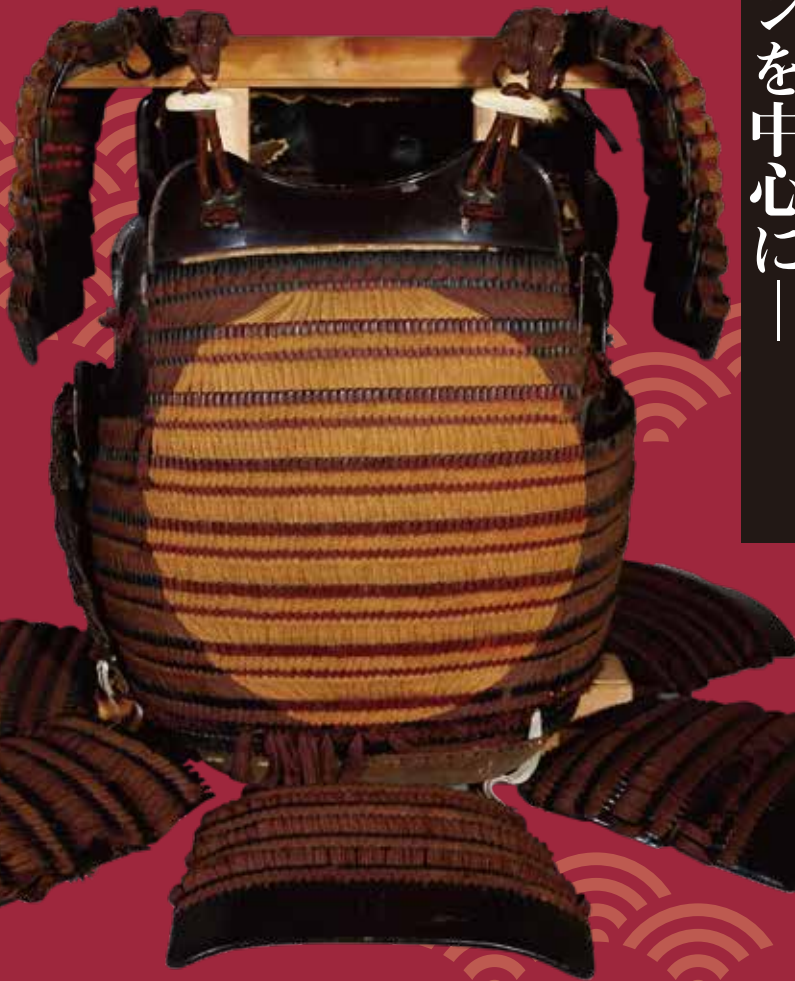
日の丸威胴丸 安土桃山時代 結城秀康所用 伊澤昭二氏蔵