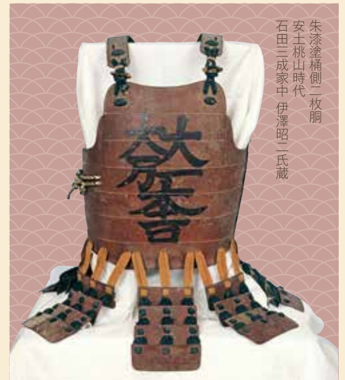
朱漆塗桶側二枚胴 安土桃山時代 石田三成家中 伊澤昭二氏蔵