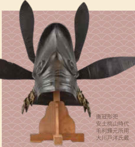
唐冠形兜 安土桃山時代 毛利輝元所用 大川戸洋氏蔵