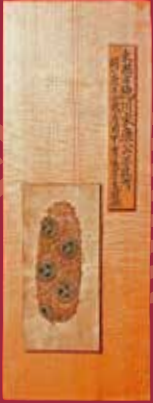
葵紋縫 甲冑籠手裂地 安土桃山時代 徳川家康所用 伊澤昭二氏蔵