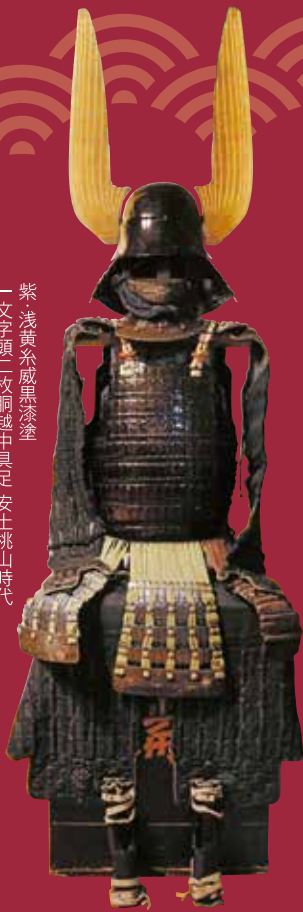
紫 浅黄糸威黒漆塗 —文字頭二枚胸越中具足 安土桃山時代 細川興元所用 伊澤昭二氏蔵