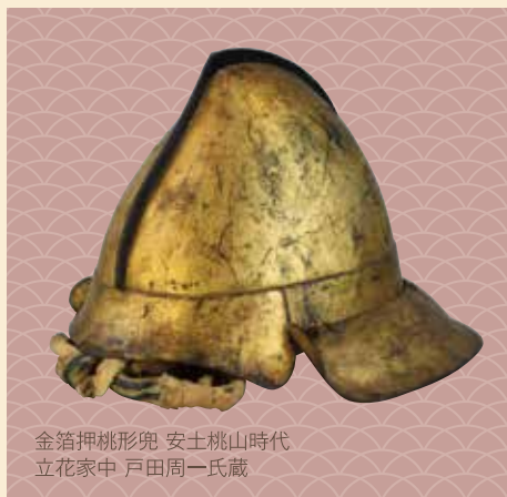
金箔押桃形兜 安土桃山時代 立花家中 戸田周一氏蔵