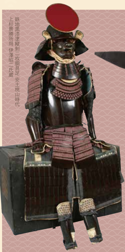
鉄地黒漆塗縦刺二枚胴具足 安土桃山時代 上杉景勝所用 伊澤昭二氏蔵