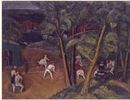
清水登之《テニスプレイヤー》 栃木市立美術館蔵