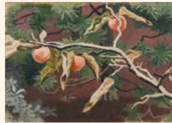
安井曾太郎《実る柿》 笠間日動美術館蔵