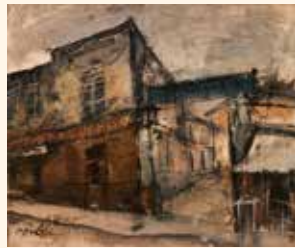
佐伯祐三《パリの街角》 笠間日動美術館蔵