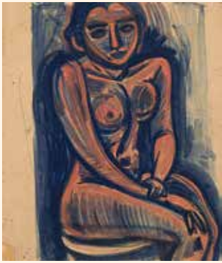
萬鉄五郎《裸婦》 笠間日動美術館蔵