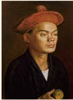
岸田劉生《丸山君の像》 笠間日動美術館蔵