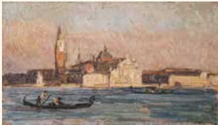
藤島武二《ヴェニス風景》 笠間日動美術館蔵